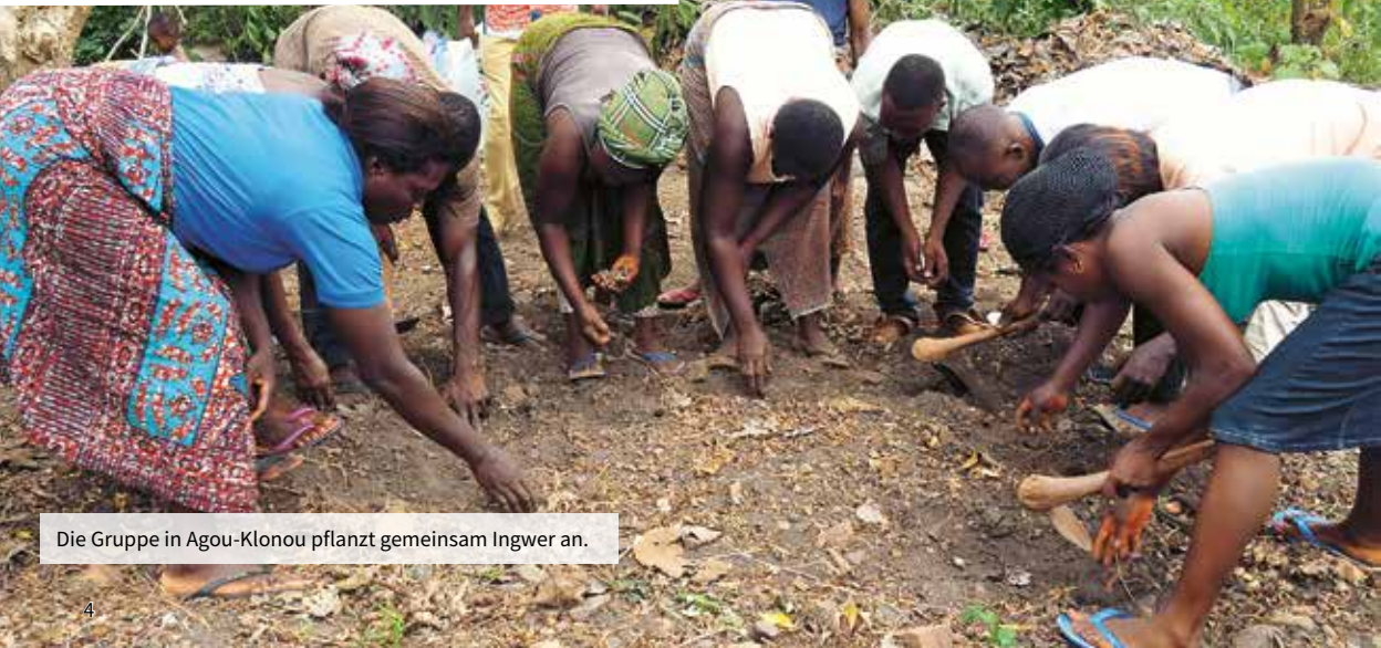
Die Gruppe in Agou-Klonou pflanzt gemeinsam Ingwer an.

NM-Projektreferent Wolfgang Blum war inzwischen vor Ort und hat sich das Projekt angesehen. „Es läuft sehr gut“, berichtet er. „Der Boden ist für den Anbau geeignet. Die Gruppe hat ein Komitee gewählt, das die Arbeit organisiert und über die Finanzen Buch führt. Der Gewinn soll zu 75 Prozent an die Gruppen-Mitglieder gehen und der weiteren Vergrößerung des Projekts dienen, 25 Prozent möchte die Gruppe der Gemeinde zur Verfügung stellen.“ Alle hätten sich sehr für die finanzielle Unterstützung aus Deutschland bedankt, so der Referent weiter. Einen großen Teil hat der Naturdufthersteller Taoasis aus Detmold bereitgestellt.