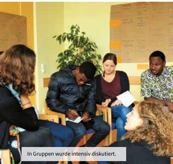
In Gruppen wurde intensiv diskutiert.

Am Abend sahen wir uns den Film „Die wahren Kosten“ an. Wie der Titel zeigt, ging es um die wahren Kosten für die Herstellung von Kleidung. Es ist nicht so nett wie ich dachte. Dabei werden Menschen erpresst. Von den Bauern, die Baumwolle anbauen, bis hin zu denjenigen, die in der Fabrik nähen. Da Kleidung meist nicht biologisch abbaubar ist, warum kaufen wir so viel? Wir tragen es nicht einmal so oft. Schnelle Mode bringt uns alle um!