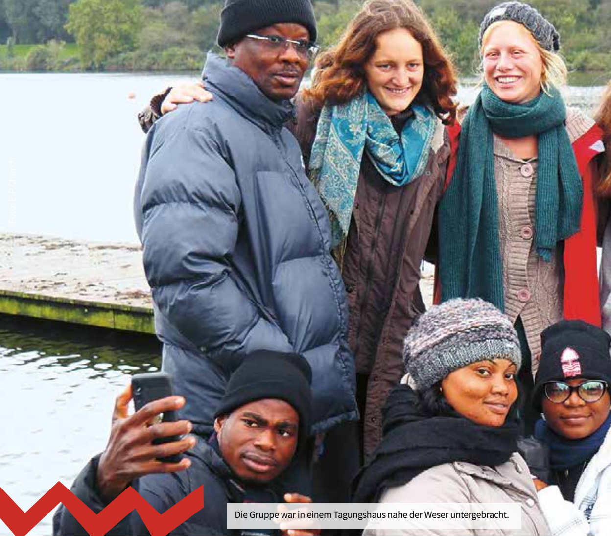
Die Gruppe war in einem Tagungshaus nahe der Weser untergebracht.